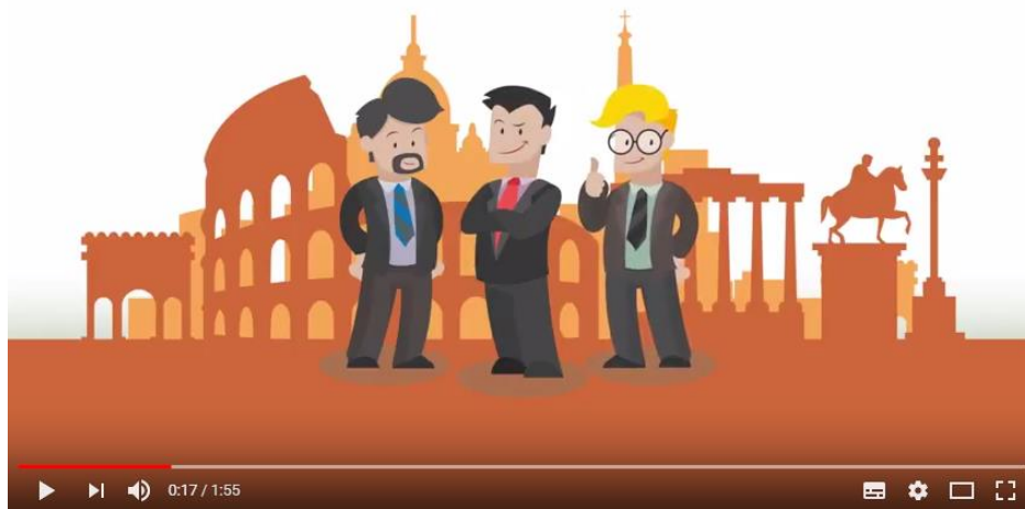
Seminario formativo strumenti finanziari UE

Il seminario è strutturato in quattro sessioni formative nelle quali sono ripartite le principali tematiche nell'utilizzo degli strumenti finanziari nell'ambito dei Fondi strutturali e di investimento europei (Fondi SIE) con i quali sono cofinanziati fondi per prestiti e per micro-prestiti, fondi di garanzia e veri e propri fondi rischi, fondi di partecipazione al capitale di rischio, contributi in conto interessi ed altri aiuti pubblici riferibili alle amministrazioni centrali e regionali. I principali temi affrontati riguarderanno le fonti informative sulle regole e sulle opportunità, i requisiti richiesti agli intermediari finanziari, i vincoli normativi (ad esempio sulle condizioni di ammissibilità delle imprese prenditrici), gli oneri relativi al monitoraggio degli strumenti, i controlli di primo e secondo livello, gli adempimenti relativi al registro nazionale degli aiuti di Stato.